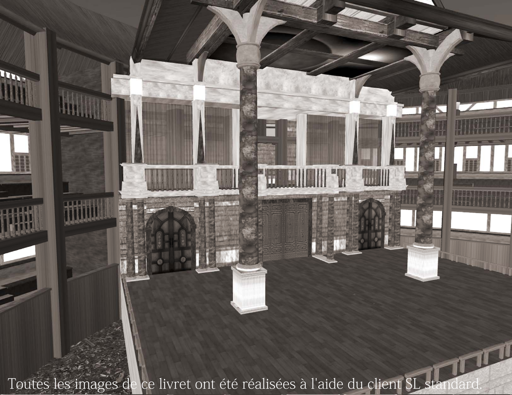
Toutes les images de ce livret ont été réalisées à l'aide du client SL standard.